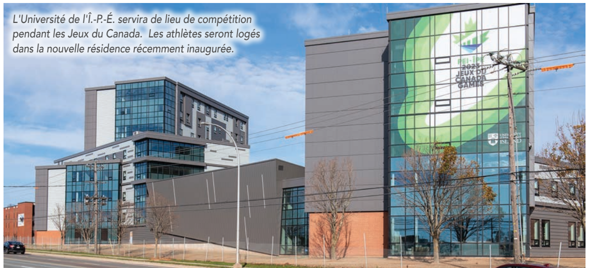
L'Université de l'Î.-P.-É. servira de lieu de compétition pendant les Jeux du Canada. Les athlètes seront logés dans la nouvelle résidence récemment inaugurée.

L'UPEI servira également de lieu de compétition pendant la première semaine pour le basket-ball en fauteuil roulant, le hockey masculin, la ringuette et pendant la deuxième semaine, pour le badminton et le hockey féminin.