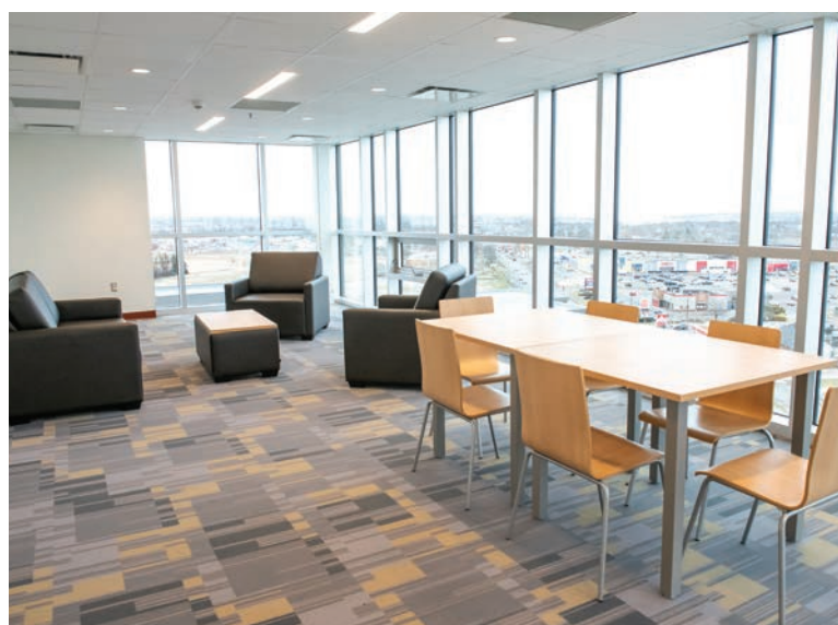
Un salon qui servira pour les Jeux du Canada.

Bienvenue sur le magnifique campus de l'Université de l'Î.-P.-É. pour les Jeux d'hiver du Canada PEI 2023. Pendant les deux semaines des Jeux d'hiver du Canada 2023 de l'Î.-P.-É., le campus de l'Université de l'Île-du-Prince-Édouard sera animé par les sons de la compétition et l'enthousiasme des participants. L'Université restera ouverte pendant les Jeux. Nous encourageons donc les visiteurs à passer à la librairie de l'UPEI, située dans le centre étudiant W. A. Murphy, pour se procurer des articles de l'UPEI et des Jeux du Canada. Les étudiants potentiels sont invités à visiter le Student Experience Hub au Dalton Hall pour parler à un membre de l'équipe d'admission/conseil de première année ou à visiter le site Web upei.ca/apply .