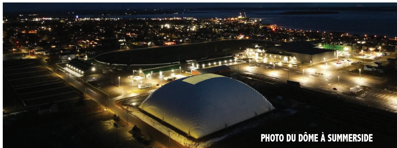
PHOTO DU DÔME À SUMMERSIDE

Les Jeux d'hiver 2023 se vivront à l'échelle de la nation et ils laisseront un héritage durable. Les investissements dans l'infrastructure locale profiteront aux générations futures, et les nouvelles installations communautaires améliorées revitaliseront la province, insufflant une vigueur nouvelle à l'Î.-P.-É.