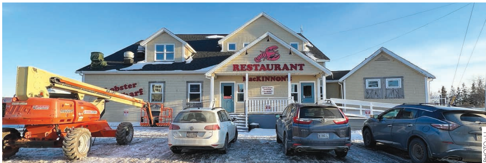
Le Pavillon de la francophonie sera situé au 2, rue Prince à Charlottetown.

Le restaurant Lobster on the Wharf, tout près de Founder's hall, sur le front de mer à Charlottetown, sera la plaque tournante de la francophonie prince-édouardienne. C'est dans cet édifice que le Pavillon de la francophonie sera installé pour accueillir les visiteurs et les membres de la communauté.